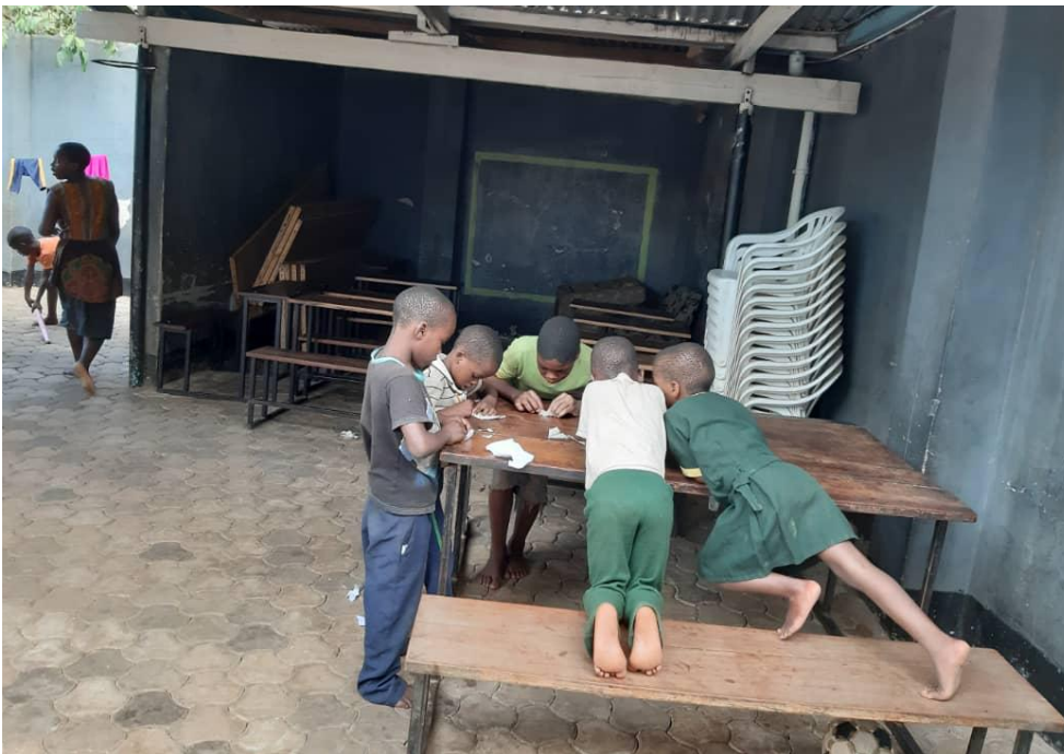
Kinderen spelen op de binnenplaats

Beste donateurs en andere belangstellenden en betrokkenen,